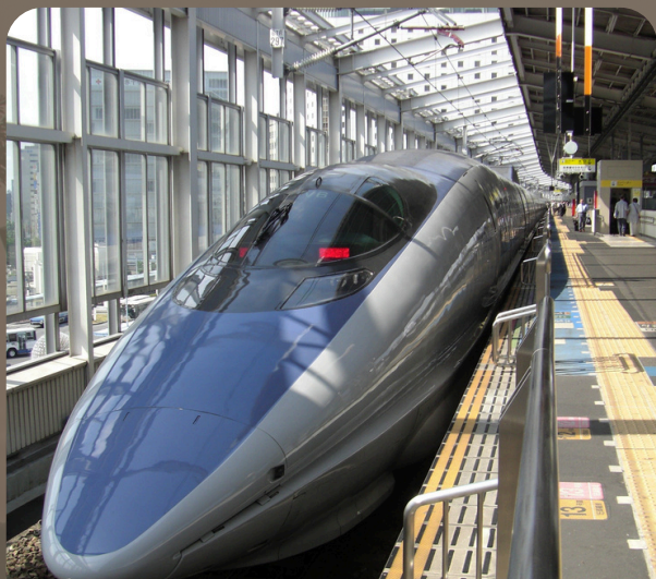
TREN BALA EN KIOTO